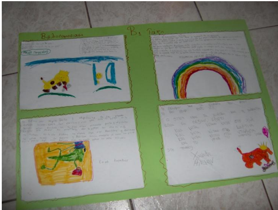
Βιβλιοπαρουσιάσεις, Β Δημοτικού, Μειονοτικό Δημοτικό Σχολείο Γλαύκης