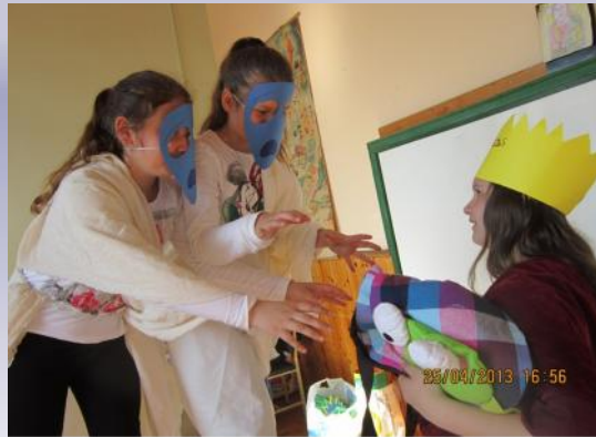
Αφηγηματικά κείμενα που παρήγαγαν τα παιδιά για τις φωτοϊστορίες που παρήγαγαν με βάση την Οδύσσεια. ΣΤ' Δημοτικού, 1 ο Δημοτικό Σχολείο Ξάνθης

Ο Οδυσσέας και οι σύντροφοί του φτάσανε στο κάτω κόσμο. Ο Οδυσσέας πήρε μαζί του το κατσικάκι και μπήκε μέσα στη σπηλιά. Εκεί μέσα υπήρχε λάβα και φωτιές. Όταν ο Οδυσσέας προχώρησε πιο μέσα είδε πάρα πολλές ψυχές. Και οι ψυχές όταν είδαν το κατσικάκι ήθελαν να το φάνε. Όμως ο Οδυσσέας δεν τις άφησε.