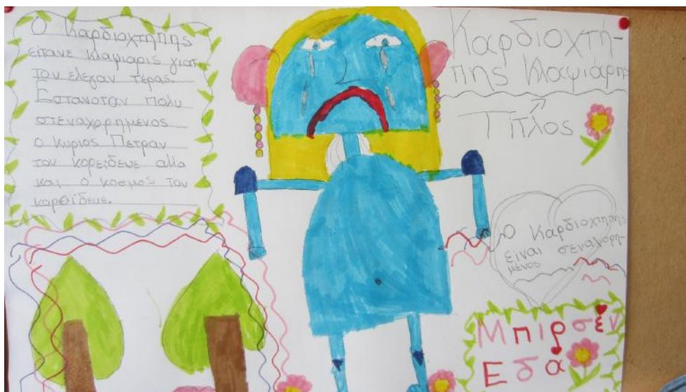
Χιουμοριστικά-αφηγηματικά κείμενα, Β-Γ Δημοτικού, Μειονοτικό Δημ. Σχολείο Σμίνθης