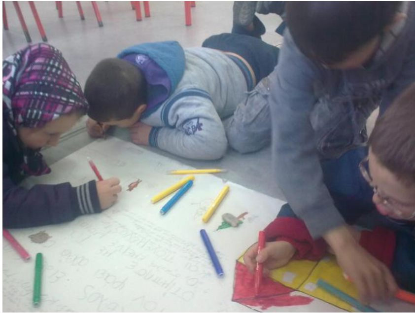
Αφηγηματικά κείμενα, γραμμένα και εικονογραφημένα από τα παιδιά σε μεγάλες αφίσες.