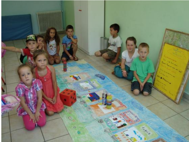
Επιτραπέζια παιχνίδια που δημιουργήθηκαν από τα παιδιά τα οποία έγραψαν και τις οδηγίες τους, Μειονοτικό Δημοτικό Σχολείο Σμίνθης