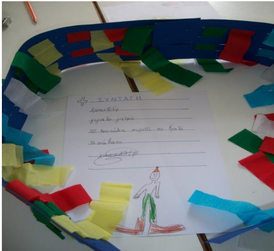
Συνταγές, Α-Β Δημοτικού, 1 ο Μειονοτικό Δημοτικό Σχολείο Κομοτηνής