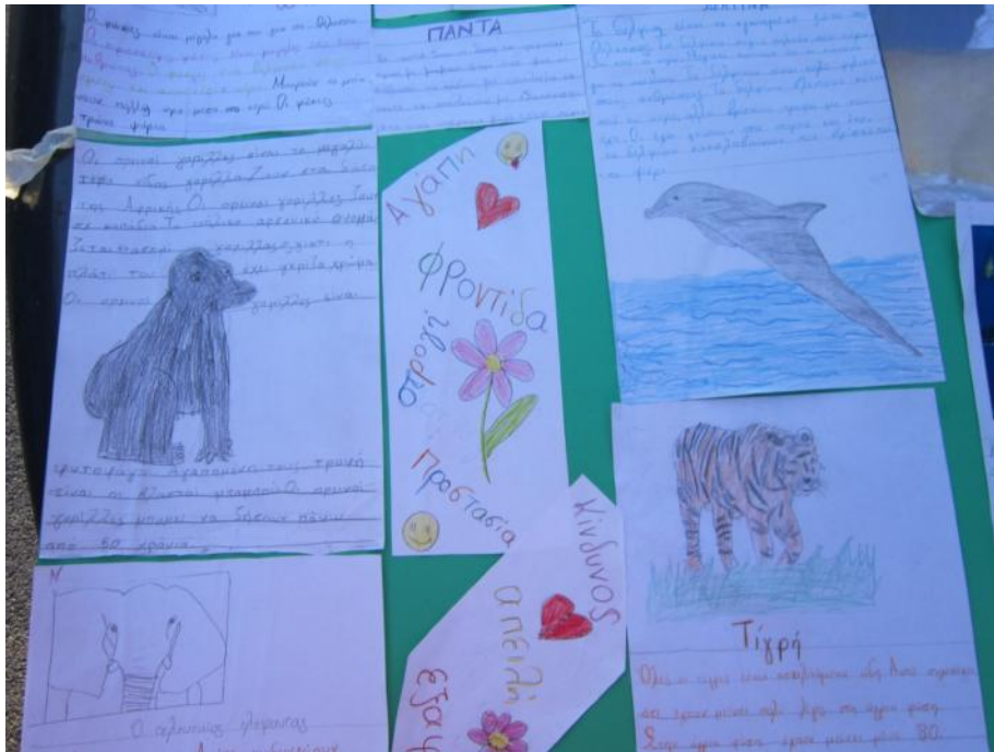
Πληροφοριακά κείμενα, Μειονοτικό Δημοτικό Σχολείο Μύκης, ΣΤ Δημοτικού