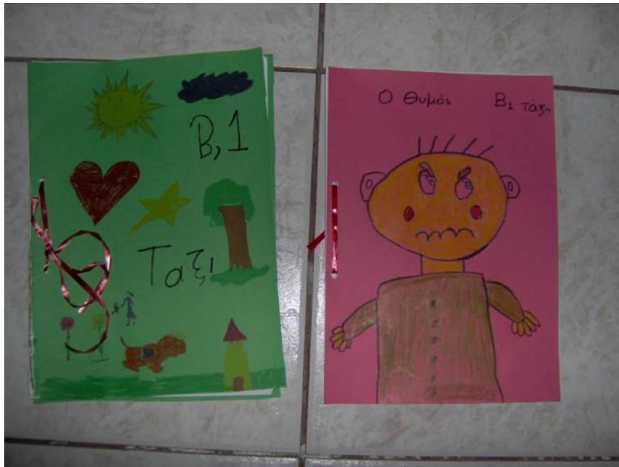
Βιβλία που έφτιαξαν τα παιδιά της Β' τάξης στο Μειονοτικό Δημοτικό Σχολείο Γλαύκης