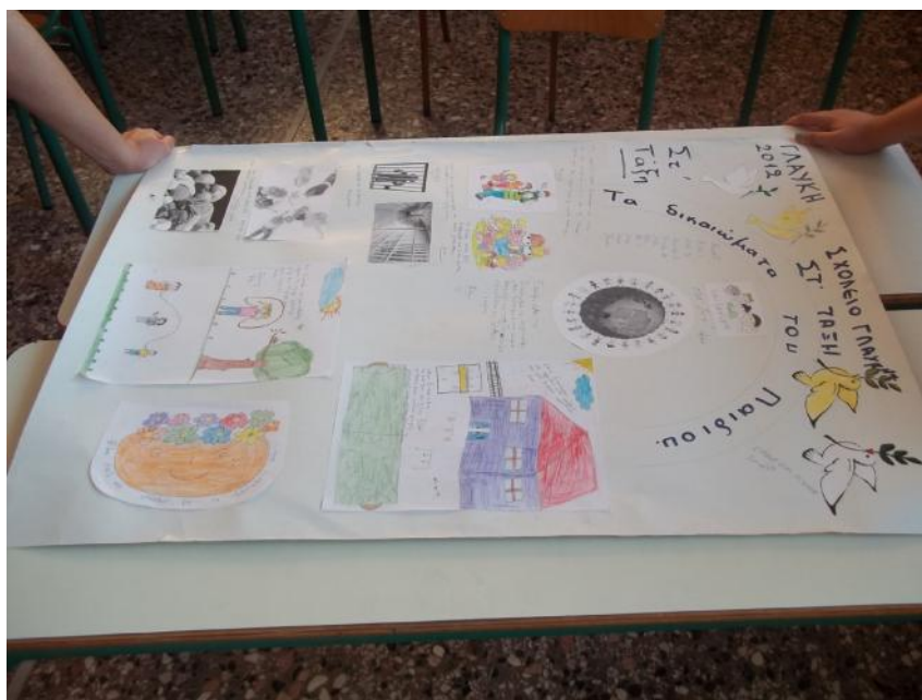
Αφίσες, ΣΤ Δημοτικού, Μειονοτικό Δημοτικό Σχολείο Γλαύκης