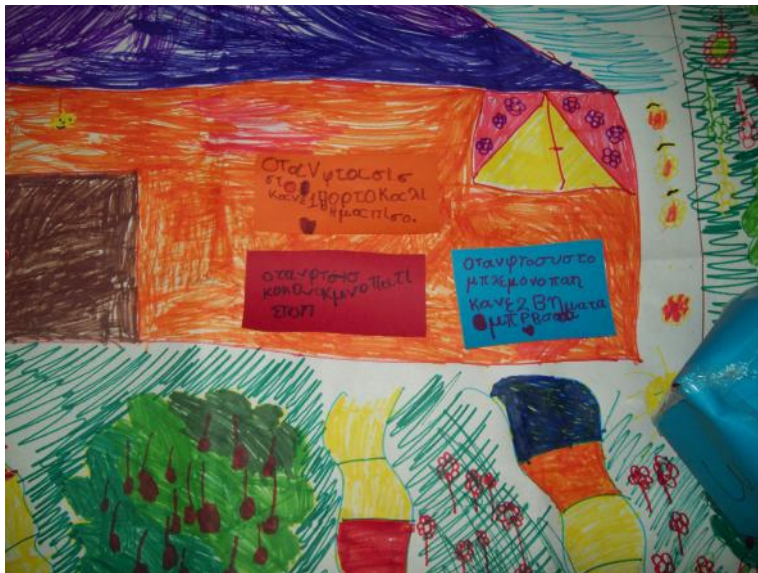
Οδηγίες επιτραπέζιου παιχνιδιού, Α Δημοτικού, 1 ο Μειονοτικό Δημοτικό Σχολείο Κιμμερίων