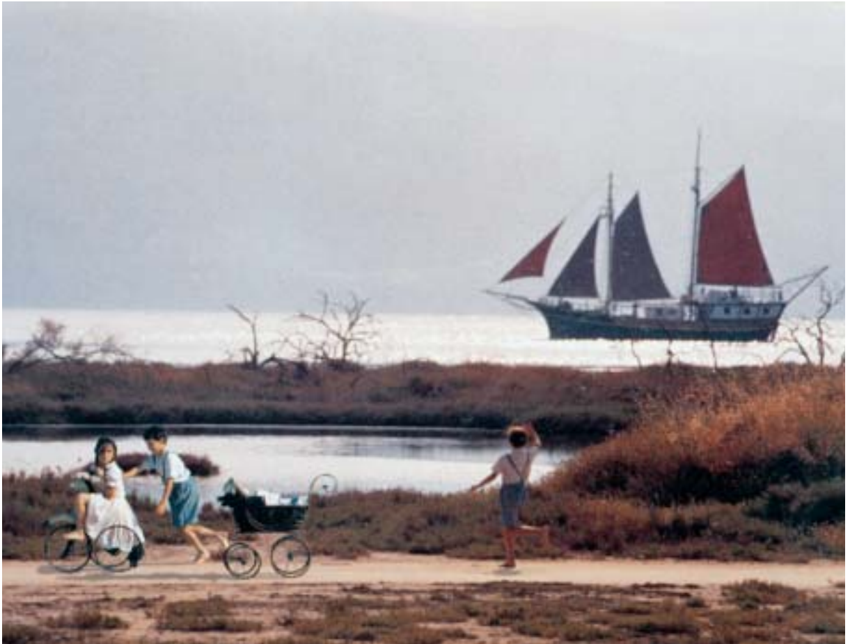
Από την ταινία Τα Δελφινάκια του Αμβρακικού , του Ντίνου Δημόπουλου, 1993