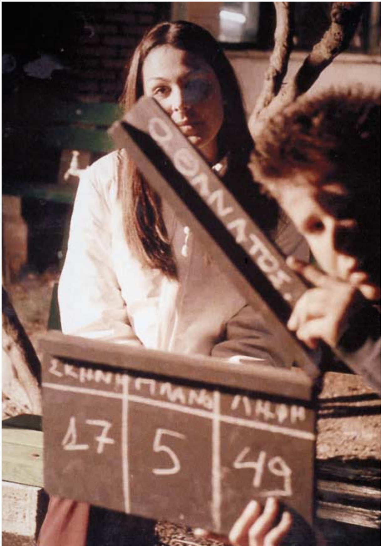
Από φυλλάδιο του προγράμματος του Φεστιβάλ Θεσσαλονίκης