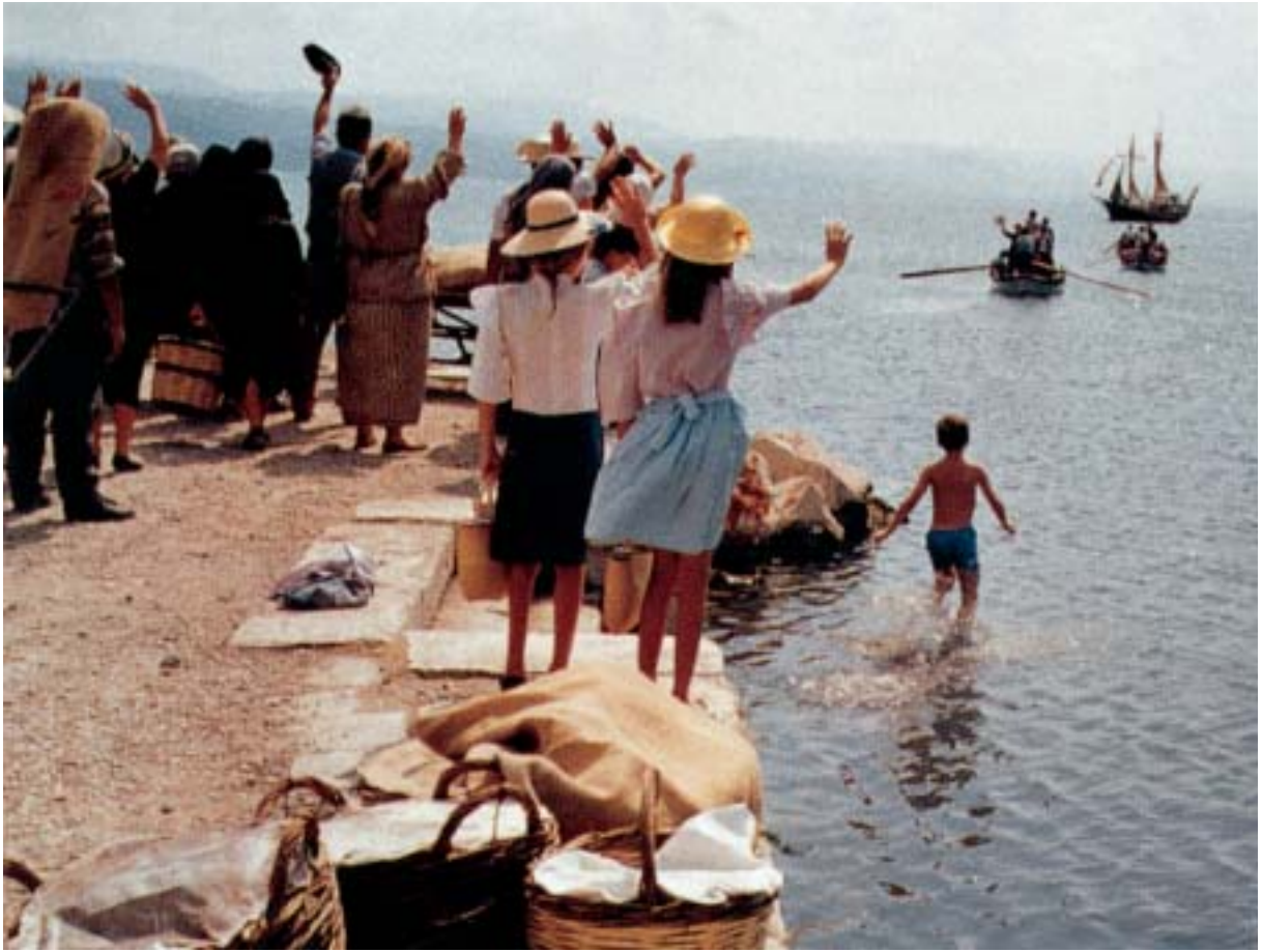
Από την ταινία Τα Δελφινάκια του Αμβρακικού , του Ντίνου Δημόπουλου, 1993