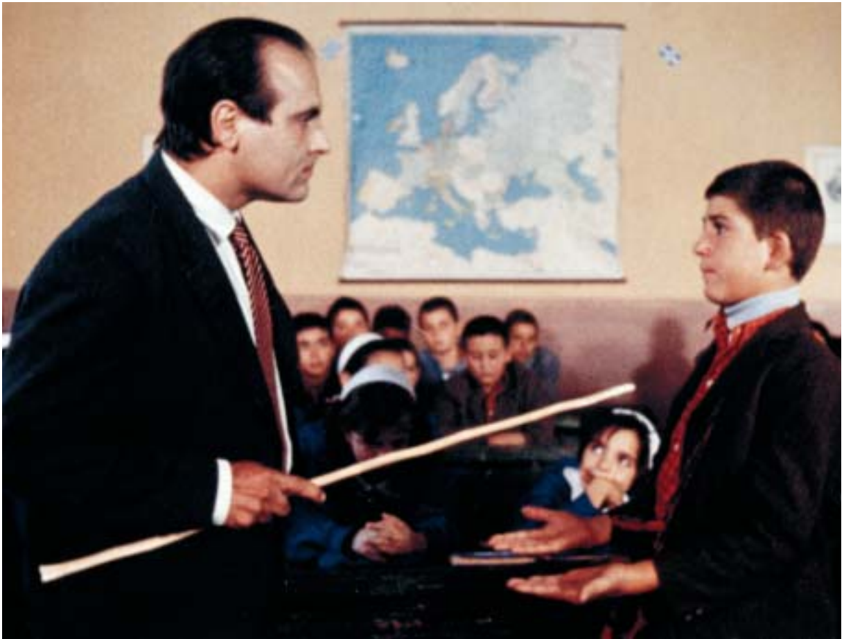
Από την ταινία Τα Δελφινάκια του Αμβρακικού , του Ντίνου Δημόπουλου, 1993