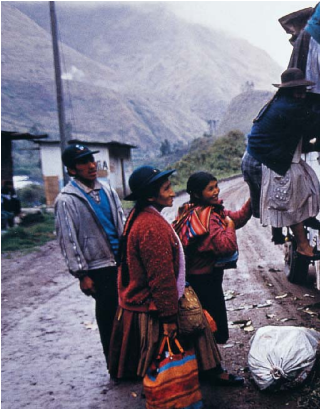
Μαρία Στέντσελ, «Νέος δρόμος για το Περού». National Geographic, Ιούνιος 2003