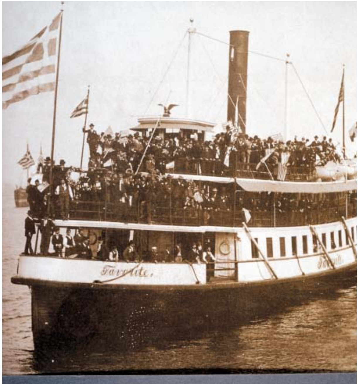
3 Σεπτεμβρίου 1900, Φιλαδέλφεια, 215 άτομα φτάνουν μετά από ταξίδι πενήντα ημερών