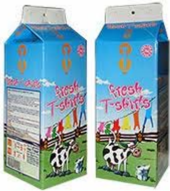
χάρτινη συσκευασία γάλακτος