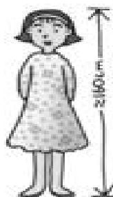
περίπου 1,60 εκ.