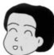
γύρω στα 50